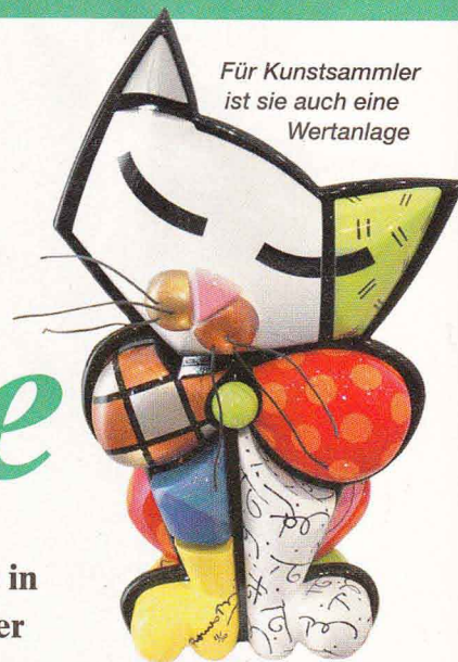
Für Kunstsammler ist sie auch eine Wertanlage

Seine knallbunten Szenen, meist in Acrylfarben auf Leinwand, trafen nicht unbedingt den Zeitgeschmack. Angepasst, geändert hat er trotzdem nichts. Egal ob Mensch, Hund, Fisch oder Katze – wenn Romero Britto sie malt oder zu einer Plastik gestaltet, strahlen sie Fröhlichkeit aus, Optimismus, pure Lebensfreude. Jedes Kunstwerk des Brasilianers ist die in Farben umgesetzte Botschaft „Das Leben ist schön!“