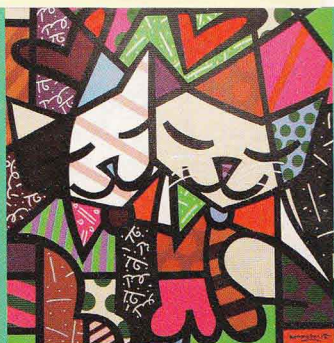
Verwandte Seelen finden sich