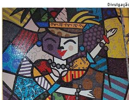
Mural com imagem de Carmen Miranda

Agora, diz o artista, ele só precisa de tempo, muito tempo. "E ele passa tão rápido que estou fazendo o máximo para ir mais rápido do que ele. Nasci com um dom e quero dividi-lo com todos."