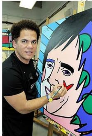
Romero Britto em seu ateliê