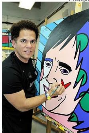
Romero Britto em seu ateliê